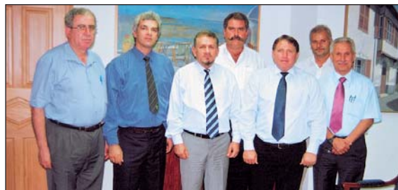
19/10/2006: Μειωμένες άδειες κυκλοφορίας, αφορολόγητο αυτοκίνητο και εκπώσεις στα μέσα συγκοινωνίας ζητήθηκαν από τον Υπουργό Συγκοινωνιών & Έργων κ. Χάρη Θράσου.