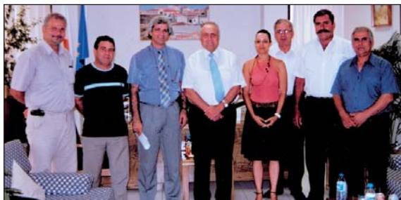
21/8/2006: Στήριξη των πολύτεκνων οικογενειών που αντιμετωπίζουν σοβαρά ιατρικά προβλήματα κατατέθηκε στον Υπουργό Υγείας κ. Χάρη Χαραλάμπους.