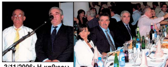
3/11/2006: Η καθιερωμένη Χοροεσπερίδα της Επαρχιακής Γραμματείας Πολυτέκνων Πάφου σημείωσε μεγάλη επιτυχία.