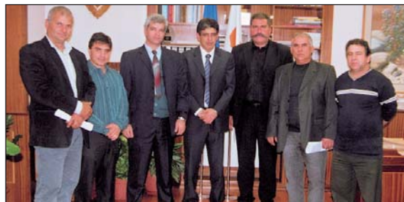
8/12/2006: Επίλυση των στεγαστικών αναγκών των πολύτεκνων οικογενειών και των παιδιών τους ζητήθηκε από τον Υπουργό Εσωτερικών κ. Νεοκλή Συλικιώτη.