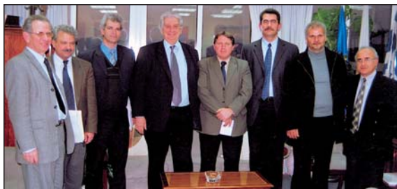
16/2/2006: Συνέχιση του δικαιώματος στις μετεγγραφές φοιτητών παιδιών πολυτέκνων, αύξηση φοιτητικής χορηγίας, παροχή υποτροφιών και άλλα ζητήθηκαν από τον Υπουργό Παιδείας κ. Πεύκιο Γεωργιάδη.