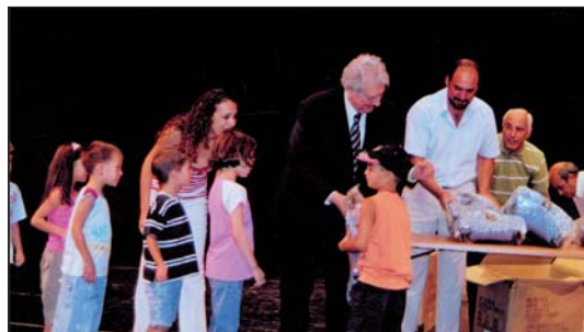
3/9/2006: Παράδοση των σχολικών τσαντών στα πρωτάκια κατά την εκδήλωση της Γιορτής της Πολύτεκνης Οικογένειας, που οργάνωσε η Επαρχιακή Γραμματεία Πολυτέκνων Λευκωσίας.