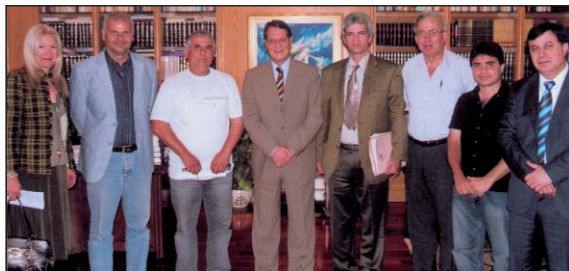
15/5/2007: Με τον πρόεδρο του Δημοκρατικού Συναγερμού κ. Νίκο Αναστασιάδη.