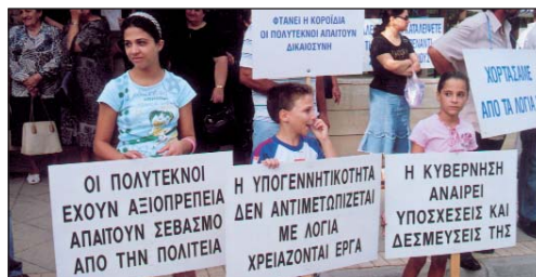
4/10/2007: Οι Πολύτεκνοι διεκδικούν ίση μεταχείριση.