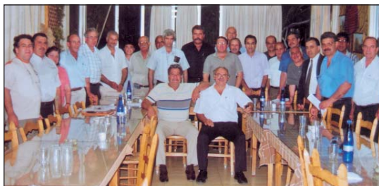
23/5/2007: Το Κεντρικό Διοικητικό Συμβούλιο της ΠΟΠ μετά από συνεδρίαση του όπου μελέτησε τα αιτήματα και τα προβλήματα των πολυτέκνων.