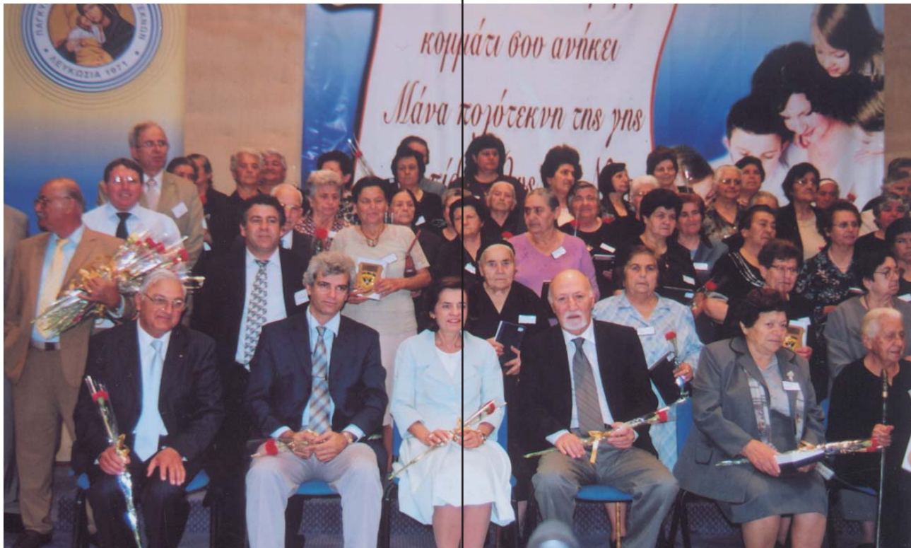
Τιμή στη Μάνα από την ΠΟΠ, την Πολιτεία, την Εκκλησία και άλλους φορείς