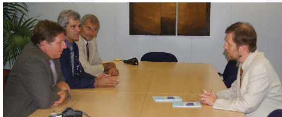
Η έρευνα της ΠΟΠ για το Δημογραφικό παραδίδεται στην Ευρωπαϊκή Ένωση

Στην περίπτωση, όμως, της Κύπρου, επειδή οι κοινωνικοοικονομικές συνθήκες αλλά και οι κοινωνικές τάσεις ευνοούν αύξηση της γεννητικότητας, με σίγουρα ευεργετικά αποτελέσματα, η δημιουργία και εφαρμογή δημογραφικής πολιτικής από το κράτος θα πρέπει να θεωρείται ως επένδυση για το μέλλον. Η επένδυση αυτή μακροπρόθεσμα θα πρέπει να θεωρείται πάντοτε κερδοφόρα. Το κράτος θα επιχορηγήσει τη γέννηση παιδιών και αυτά με τη σειρά τους, κατά τη διάρκεια της ωφέλιμης ζωής τους, θα προσφέρουν πίσω στο κράτος πολύ περισσότερα, από όσα το κράτος θα έχει πληρώσει για αυτούς, υπό τη μορφή φόρων, εισφορών στο Ταμείο Κοινωνικών Ασφαλίσεων κλπ. Παράλληλα, θα συνεισφέρουν και στην αύξηση του ρυθμού ανάπτυξης της οικονομίας, αφού αυτή θα διαθέτει περισσότερο εργατικό δυναμικό.