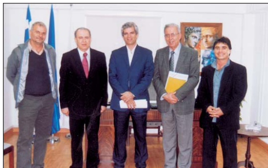
13/12/2007: Στήριξη στις Πολύτεκνες Οικογένειες ζητήθηκε από τον υποψήφιο Πρόεδρο κ. Γιαννάκη Κασουλίδη.