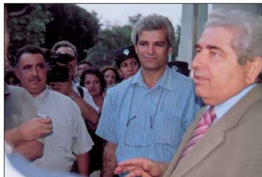
4/10/2007: Συνάντηση της ηγεσίας της ΠΟΠ με τον Πρόεδρο της Βουλής κ. Δημήτρη Χριστόφια. Οι πολύτεκνοι ζήτησαν την υποστήριξη της Βουλής.