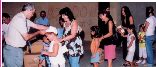
Παράδοση σχολικών τσαντών στα πρωτάκια της Επαρχίας Αμμοχώστου