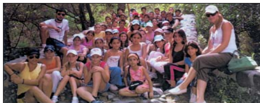
Από την κατασκήνωση παιδιών Επαρχιακής Επιτροπής Λεμεσού