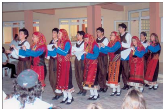
Από δραστηριότητες της Επαρχειακής Επιτροπής Λάρνακας.