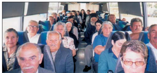
Από εκδρομή συνταξιούχων Πολυτέκνων Επαρχίας Πάφου