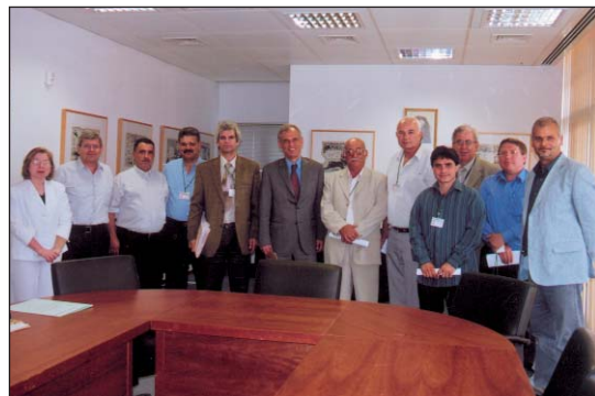
18/5/2007: Ολοκλήρωση υλοποίησης υποσχέσεων καθώς επίσης και αύξηση του επιδόματος τέκνου ζητήθηκε από τον Υπουργό Οικονομικών.